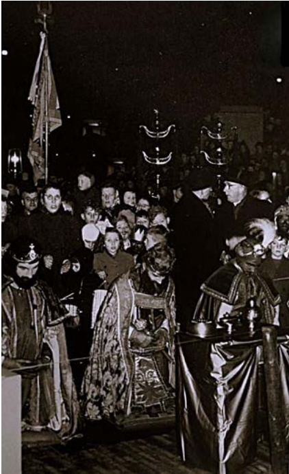
Driekoningen bieden het kerstkind hun geschenken aan, 1949. (D.J. van der Ven, Het carnavalsboek van Nederland)