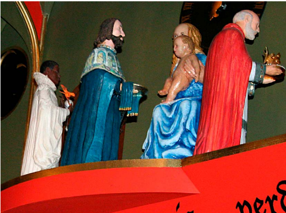
Detail oordeelspel JBAC. Bezoek van de drie koningen aan Maria en het Kind.

Hezenmans in de periode 1870-1885. In deze periode werden alle luchtboogbeelden vervangen door replica's. Hezenmans heeft van de oorspronkelijke luchtboogfiguren een vrije interpretatie gemaakt door hier de beeldjes van de drie koningen te plaatsen.