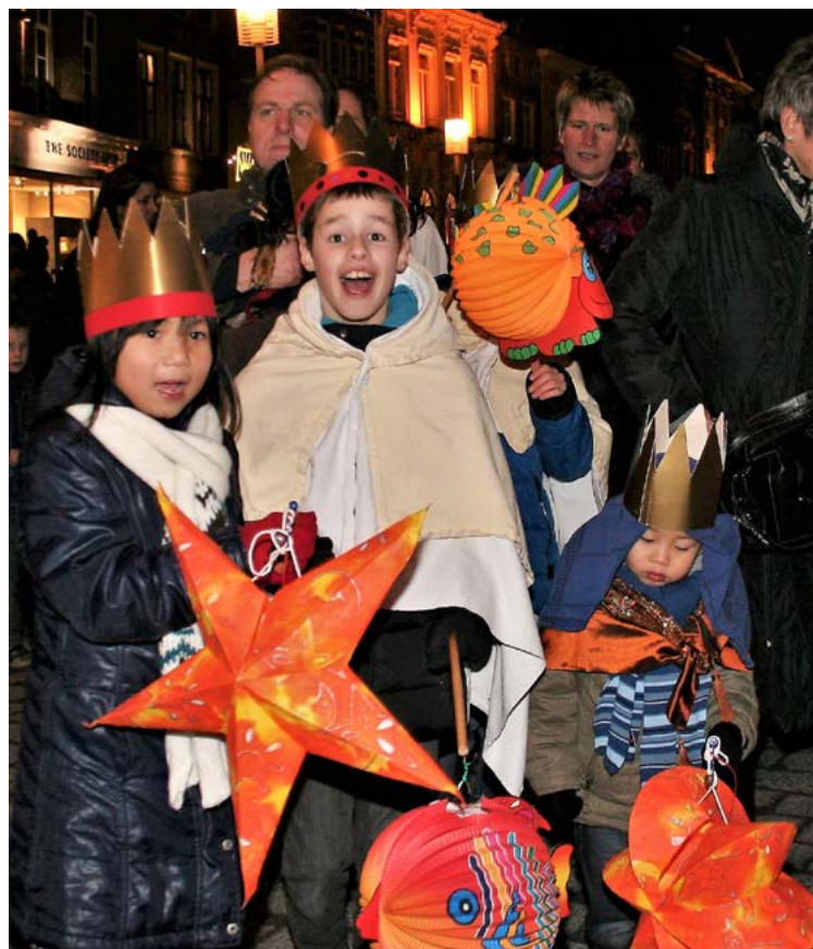
Driekoningen Markt 2012

De georganiseerde Driekoningentocht mag zich verheugen in een toenemend aantal deelnemers. In 1968 nemen zo'n 700 koninkjes aan te tocht deel, een jaar later zijn het er zelfs 1000. Ook deelt het Comité gratis lampionnen uit. Vanaf 1969 eindigt de stoet in de Sint-Jan, waar de drie koningen hun gaven bij het kerstkind in de kerststal leggen. Deze opzet zal blijvend worden. De kerststal op de Markt wordt niet meer opgebouwd. De collecte voor de Stille Armen blijft nog enige jaren bestaan, maar wordt uiteindelijk afgeschaft. Kinderen, geholpen door hun