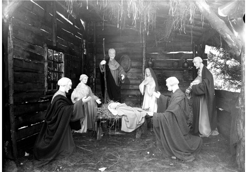
Kerststal op de Markt.