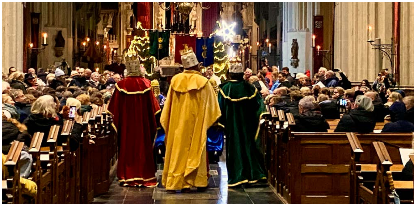
Driekoningen, in de Sint-Janskathedraal, 5 januari 2025