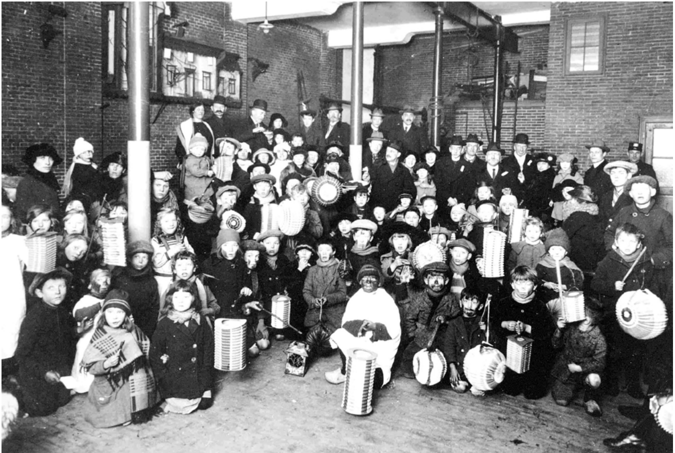
De deelnemertjes aan de Driekoningen-wedstrijd bijeen in de Boterhal. Het organiserend comité kijkt vanaf de achterste rij toe. 6 januari 1924.