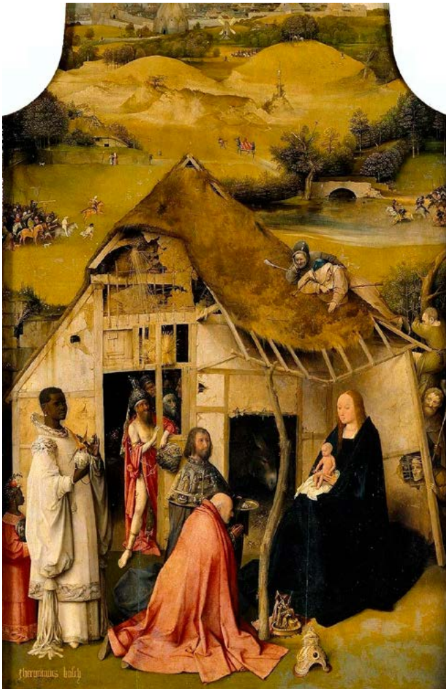
Jeroen Bosch, Aanbidding de koningen, 1490-1500 Prado Madrid, Publiek Domein .