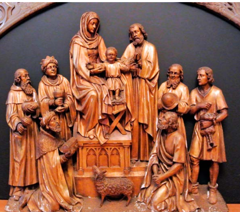
Aanbidding van het kerstkind door de koningen en de herders. Houten retabel, gepolychromeerd en afkomstig van het hoofdaltaar van de Leonarduskerk is gemaakt door Hendrik van der Geld circa 1908. Het bevindt zich nu op de plebanie.

Los van de groei van de kerkelijke aandacht voor het verhaal van Driekoningen, gaat de jeugd ieder jaar op 6 januari de straat op om dit feest op hun eigen wijze te vieren. Opmerkelijk is dat het 'protestliedje' uit de achttiende eeuw Driekoningen geef mij een nieuwe hoed in de negentiende eeuw nog steeds gezongen wordt en