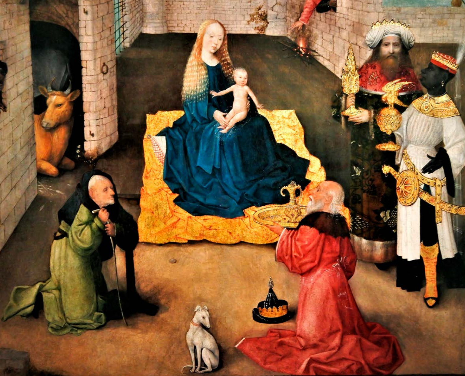
Bezoek van de Drie Koningen aan Maria en het Kind. Jeroen Bosch ca. 1470. De panelen op de achtergrond doen denken aan een toneel.

drie koningen uitbeeldde. Dit Driekoningenspel was in de vroege vijftiende eeuw voor de Onze Lieve Vrouwe Broederschap samengesteld. In 1526 liepen daar onder meer 'scaepherderkens' in mee. Dit spel was populair in de stad en werd jaarlijks onveranderd gespeeld tot aan het begin van de zeventiende eeuw. De Bossche schilder Jeroen Bosch moet het Driekoningenspel vanaf zijn woning aan de Markt vaak hebben aanschouwd. Zijn vroegste Driekoningenschilderij uit de periode 1470-1480 heeft veel weg van een toneelmatige opbouw, wellicht gebaseerd op het spel dat hij op de Markt aanschouwde.