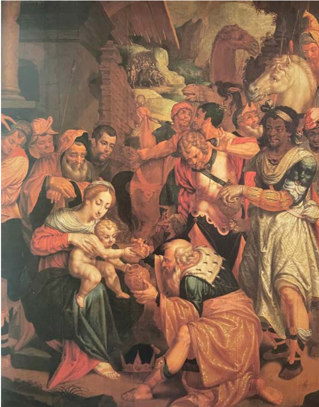
Aanbidding der Koningen 1606, Schilderij van H.v.O., Sint-Cathrienkerk 's-Hertogenbosch.

dan over stompjes kaars. Terwijl de kaarsjes brandden en de kinderen hier overheen sprongen, zong men 'Koningskaarsje, lik mijn laarsje, Lik mijn scheen, toch spring ik er overheen'. De bedoeling was dat men over drie brandende