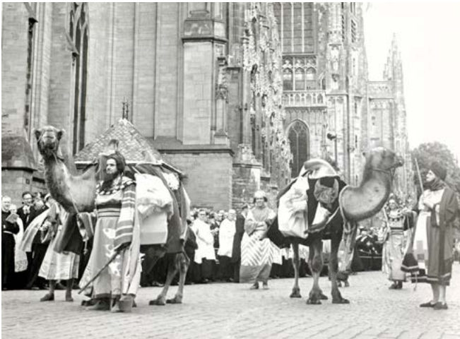
Driekoningen in de Plechtige Omgang omstreeks 1953. Foto's Erfgoed 's-Hertogenbosch no 0004924 en 0004925.