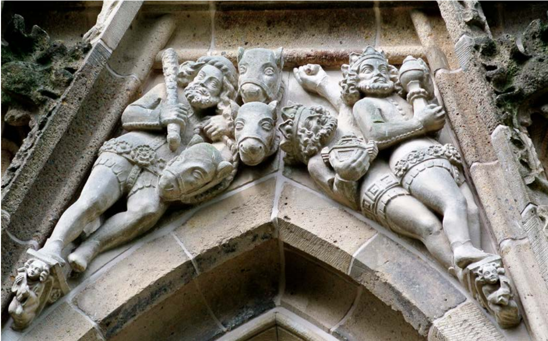
Wimberg bij de kooromgang van de Sint-Jan met afbeelding van het verhaal van de Drie Koningen.

Op de vierde luchtboog vanaf het westen aan de zuidkant van de kathedraal komen we de drie koningen nogmaals tegen. Hoewel de luchtboogfiguren oorspronkelijk zijn gemaakt in het laatste kwart van de vijftiende eeuw, zijn deze koningen ontworpen door architect Lambert