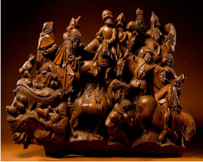
'Ontmoeting van de drie Koningen' door Adriaen van Wesel, 1475-1477. Rijksmuseum Amsterdam.