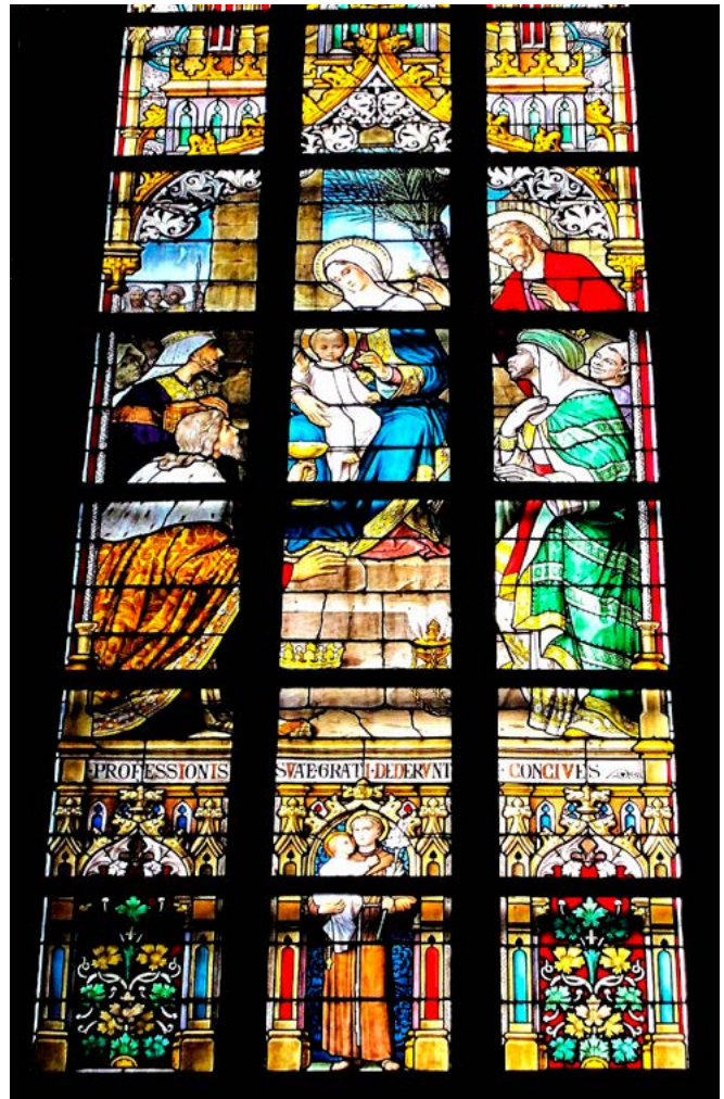
Bezoek van de koningen aan het kerstkind en zijn moeder. Gebrandschilderd raam Sint-Josephkerk 's-Hertogenbosch, ontwerp L. Hezenmans, atelier Capronnier, Brussel 1891.

huizen trokken met een zelfgemaakte lampion: een stok met een aardappel erop en een kaarsje omsloten door een versierde papieren zak. Van de eertijds rijke traditie van het zingen van Driekoningenliederen is niets meer over, constateert Teulings met weemoed.