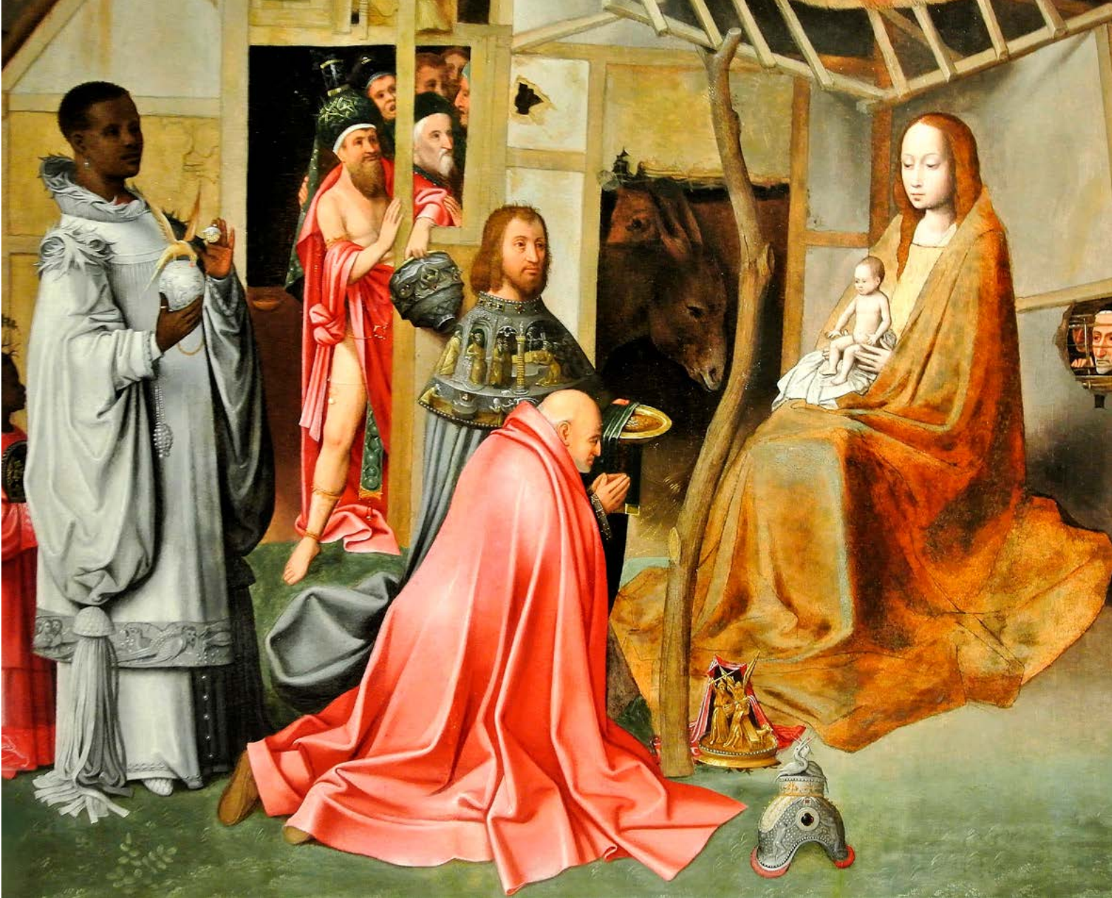
Jeroen Bosch Aanbidding der Koningen, 1490-1500. Prado Madrid.

kwamen om eer te bewijzen aan Maria met Kind. Bij de reconstructie van het Oordeelspel in 2010 heeft dit tafereel opnieuw een plek gekregen, naar het model van het schilderij van Jeroen Bosch van de Aanbidding der Koningen (1490-1500).