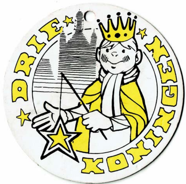
Herinneringsinsigne voor de deelnemers aan de Driekoningentocht van het Comité Bossche Folklore.

etalages ingeruimd voor lampionnen en papieren kronen. Die werden dan goed verkocht. Was men met drieën dan werd er vaak één aangewezen als zwarte koning. Die werd dan zwart gemaakt met een kurk, die men boven een gasvlam hield. De zwarte koning was vaak de schatbewaarder en droeg de aangereikte 'geschenken' in een koekblik mee. De koninkjes belden dan aan bij bekenden uit de straat en bij familieleden, die het bezoek van de koninkjes op prijs stelden. Na een uur of anderhalf ging men weer huiswaarts, waar de buit werd verdeeld. Vooral in de buitenwijken met portiekflats hielden mensen de deur angstvallig gesloten en reageerde men niet op aanbellen. Ook toen waren er mensen, meestal afkomstig van buitenaf, die een hekel hadden aan het 'geschooi' aan de deur en niet bekend waren met deze traditie. Uiteindelijk bloedde het Driekoningenzingen aan de deur dood in de jaren 1980 en 1990. Aan een eeuwenlange traditie kwam zo een eind. Alleen de georganiseerde Driekoningenviering in de binnenstad bleef in deze eeuw bestaan en geeft het feest weer nieuw elan.