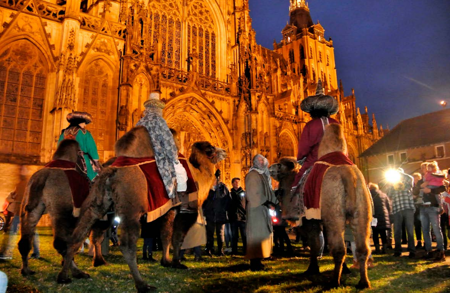
Driekoningen bij de Sint-Janskathedraal, 2019

Van 1964 tot 1993 wordt de Driekoningentocht georganiseerd door het Comité 'Bossche Folklore', dat ook de Intocht van Sint-Nicolaas voor zijn rekening neemt.