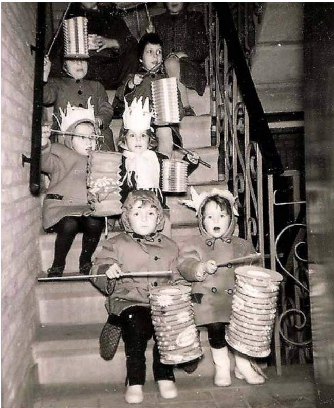
Driekoningenzingen in de Pieter Breughelstraat 1963.

Deze tocht, waarbij de muziek werd verzorgd door het 's-Hertogenbosch Muziekcorps werd georganiseerd door het 'Centrum Comité' later 'Comité Groot Zakencentrum' geheten. Tot 1962 organiseert dit Comité de jaarlijkse Driekoningentocht. Bij al deze tochten staat de deelname van kinderen centraal.