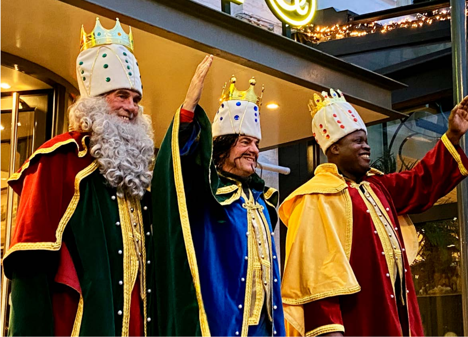
Driekoningen hotel Central Markt 's-Hertogenbosch 5 januari 2025.

etalages ingeruimd voor lampionnen en papieren kronen. Die werden dan goed verkocht. Was men met drieën dan werd er vaak één aangewezen als zwarte koning. Die werd dan zwart gemaakt met een kurk, die men boven een gasvlam hield. De zwarte koning was vaak de schatbewaarder en droeg de aangereikte 'geschenken' in een koekblik mee. De koninkjes belden dan aan bij bekenden uit de straat en bij familieleden, die het bezoek van de koninkjes op prijs stelden. Na een uur of anderhalf ging men weer huiswaarts, waar de buit werd verdeeld. Vooral in de buitenwijken met portiekflats hielden mensen de deur angstvallig gesloten en reageerde men niet op aanbellen. Ook toen waren er mensen, meestal afkomstig van buitenaf, die een hekel hadden aan het 'geschooi' aan de deur en niet bekend waren met deze traditie. Uiteindelijk bloedde het Driekoningenzingen aan de deur dood in de jaren 1980 en 1990. Aan een eeuwenlange traditie kwam zo een eind. Alleen de georganiseerde Driekoningenviering in de binnenstad bleef in deze eeuw bestaan en geeft het feest weer nieuw elan.