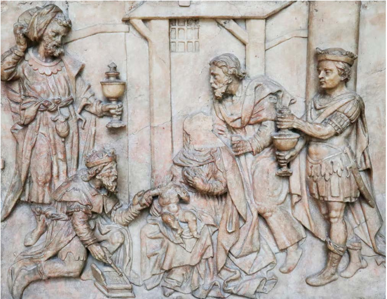
Beschadigde marmeren afbeelding van het bezoek van de Koningen aan het kerstkind op het oksaal van de Sint-Jan, nu in het Victoria en Albertmuseum in Londen.