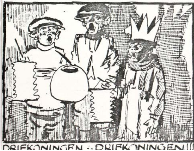
Bossche Driekoningen-zangertjes, getekend door Herman Moerkerk in 1922 (PNHC).

De Driekoningenoptocht van 6 januari 1929 trekt door de Hinthamerstraat ter hoogte van de Sint-Jan. De stoet wordt voorafgegaan door een drietal edelknappen met goud, wierook en mirre. Een heraut met het vaandel van de Missievereeniging met het Koninklijke Harmonie Goulmy en Baar. Vooraan een aantal jongens met lampions en collectebussen. Foto Erfgoed no 0009672.