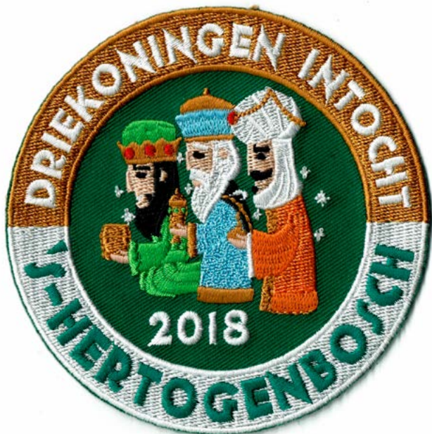
Logo van de Stichting Intocht Driekoningen 's-Hertogenbosch, hier als embleem uitgegeven in 2018

ouders, doen nog ieder jaar hun best om zich te verkleeden en zich te schminken, waardoor de stoet een bonte verzameling van mooi uitgedoste koningen is. De deelname van de koninkjes verschilt per jaar, wat mede afhankelijk is van de (soms barre) weersomstandigheden.